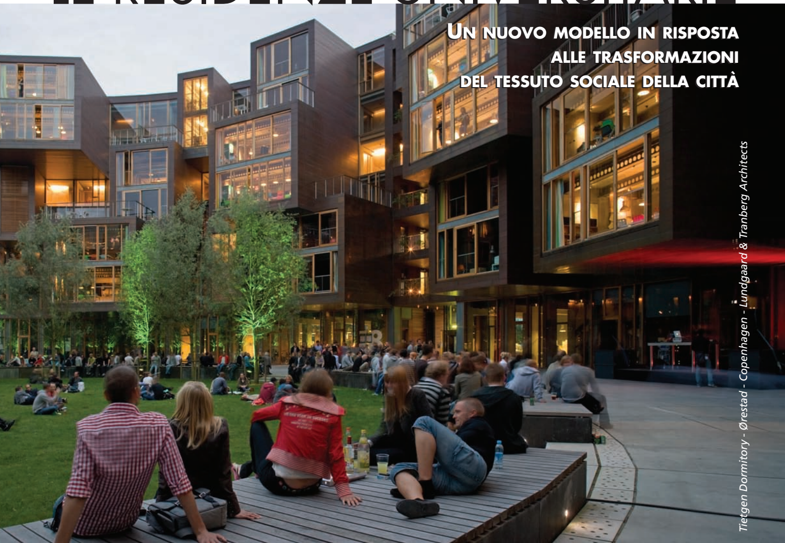
Tietgen Dormitory - Ørestad - Copenhagen - Lundgaard & Tranberg Architects

UN NUOVO MODELLO IN RISPOSTA ALLE TRASFORMAZIONI DEL TESSUTO SOCIALE DELLA CITTÀ