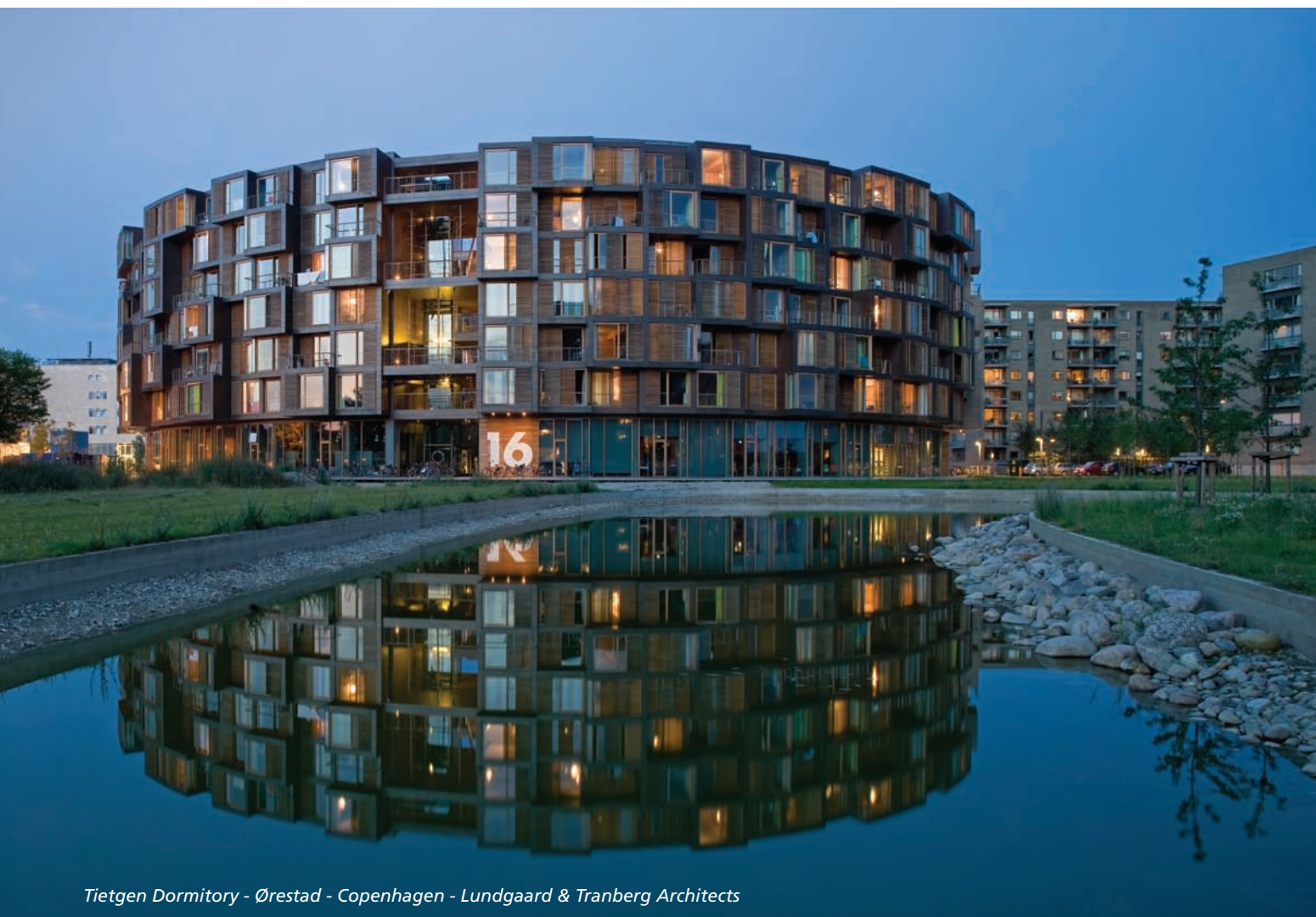
Tietgen Dormitory - Ørestad - Copenhagen - Lundgaard & Tranberg Architects