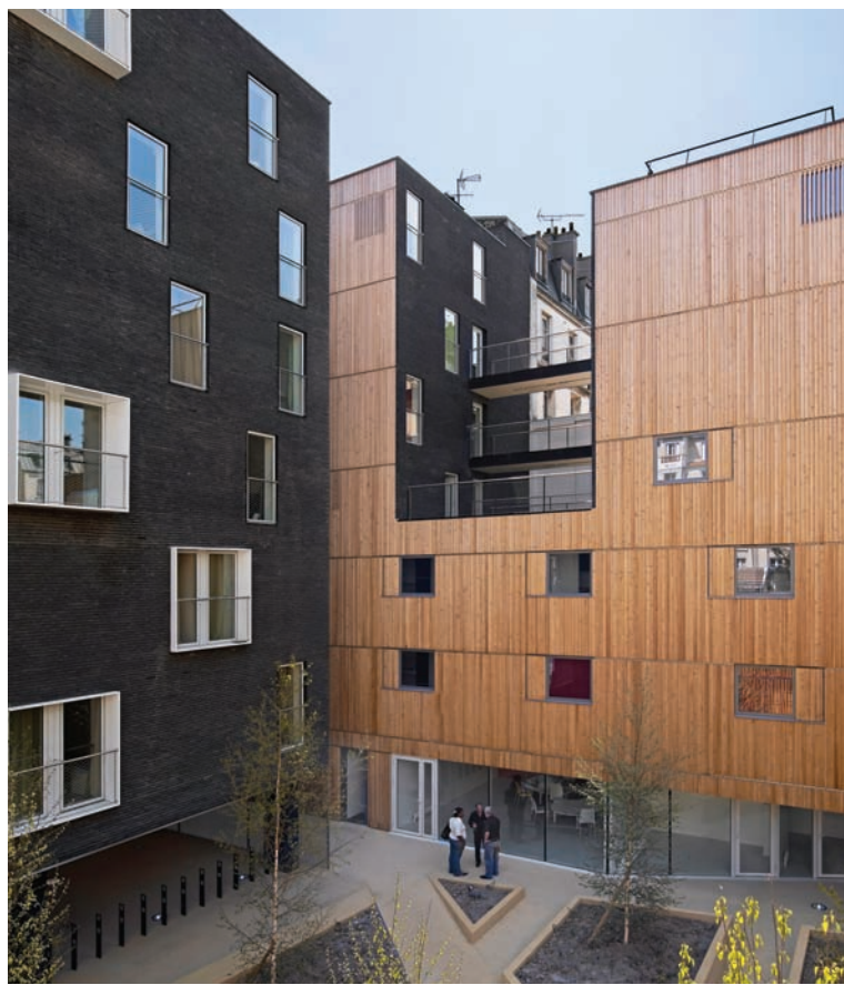
Paris - LAN Architecture

Quest'anno il Ministero ha rilanciato il tema delle residenze per studenti emanando due nuovi provvedimenti, i DD.MM. n. 26 e 27 del 07/02/2011 attraverso i quali sono stanziati nuovi fondi per il cofinanziamento nella realizzazione, ristrutturazione o acquisto di alloggi per studenti e sono ridefiniti gli standard abitativi dimensionali e qualitativi degli alloggi (sulla base della precedente Legge 338/2000).